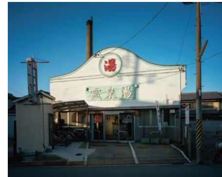
靈泉湯 Reisenyu / Day appearance / 2014

獲獎： 2012年「村的記憶」三重縣津市文化獎勵賞受賞 2012年「村的記憶」林忠彥賞最終候補名單