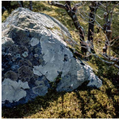
private garden, kyoto, 2013