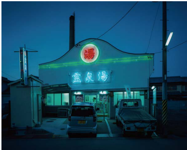
靈泉湯 Reisenyu / Night appearance / Neon / 2014