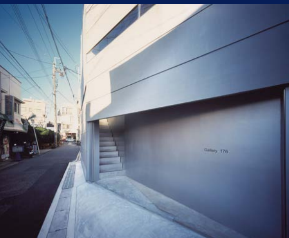
gallery 176 / Toyonaka-shi, OSAKA, JAPAN