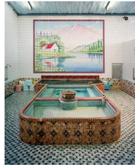
春日温泉 Kasuga Onsen / Woman bath / 2014