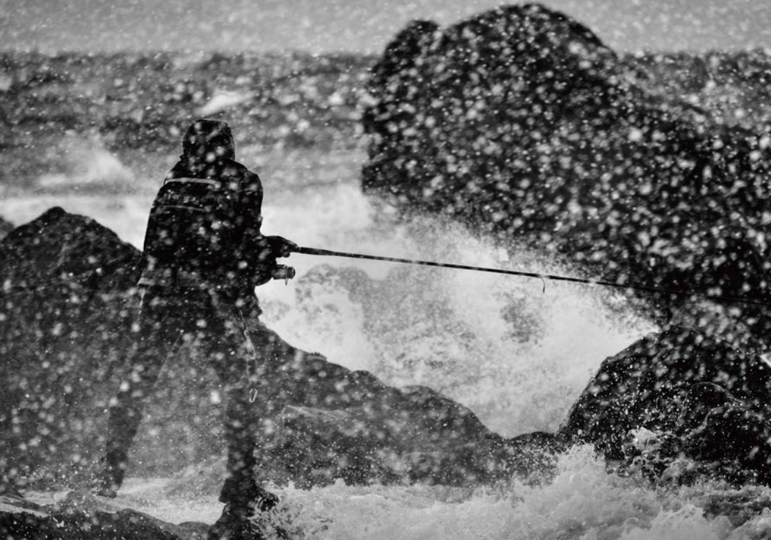
The sea of COVENANT 2018